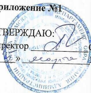
График приёма заявлений в первые классы